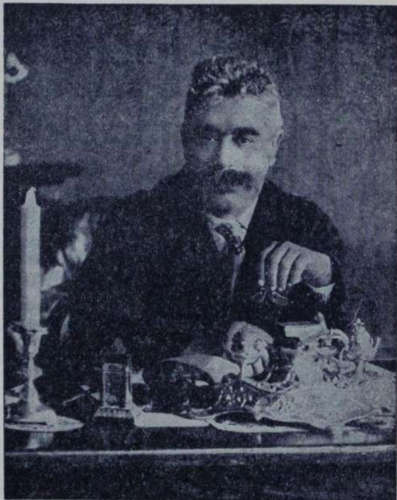
י. ל. פרץ

פינטעלעך וואקסן אויס צו גרויסע נשמה-ייתה-יידן — יעדעס פינטעלע איין גרויסער מיטלפונקט! א פונקט ארום וואס די גאנצע וועלט דרייט — אלע גלגלים, אלע עולמות עליונים — — — — — י. ל. פרץ, דער באווסטער ייד, דער קאסמישער מענטש האט אראפגע- ברענגט אלע ש"י-עולמות אין יעדן קליינעם שטעטל אריין; ער האט אונז די מאדערנע מענטש געמאכט פאר באווסטע יידן.