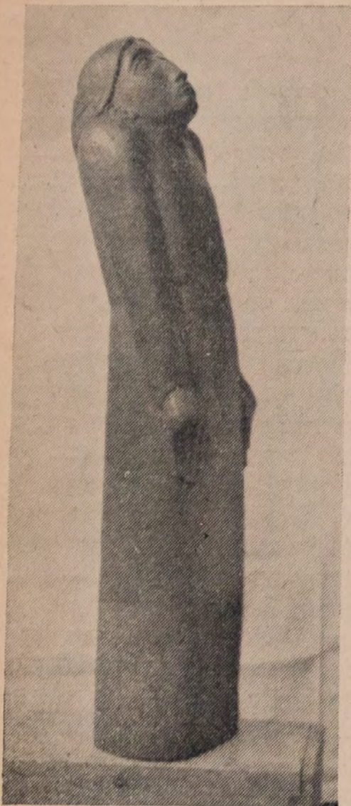
„אשא עיני אל ההרים“ סקולפטור פון בענא שאץ

איך די טעג פון יום נוראים, האב רחמנות, טאטע זיסער, מאך מיך נישט ווי יענע פרויען, מיט די יארן — ביזער מיאוס'ער.