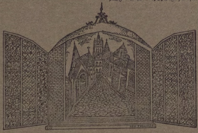
מיניאטור-צייכענונג דוד טוישנסקי

דער באקאנטער פארזער מיניאטור-צייכנער, דוד טוישנסקי, האט פערגאנגענעם חודש געהאט אן איסשטעלונג פון זיינע ווונדערלעכע צייכענונגען אין בן אורי. צווישן די לאנדאנער גאלעריעס וואס האבן אפגעקויפט זיינע צייכענונגען געהערט אויך דאס בריטישע מוזעאום — דאס איז א באדייטנדיגע דערגרייכונג פון א יידישן קינסטלער.